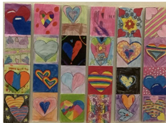
Kunstverk av 3. steg 2022/23